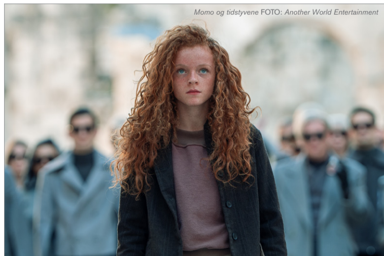
Momo og tidstyvene