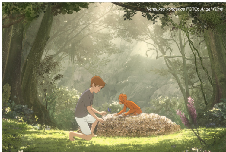
Kensukes kongerige