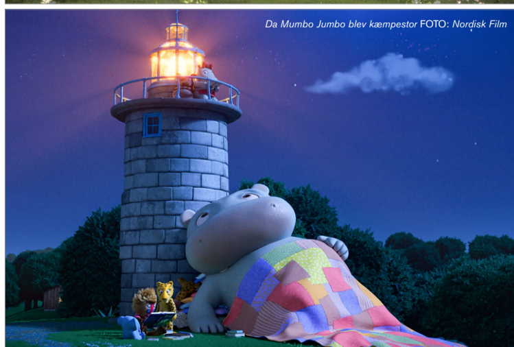
Da Mumbo Jumbo blev kæmpestor